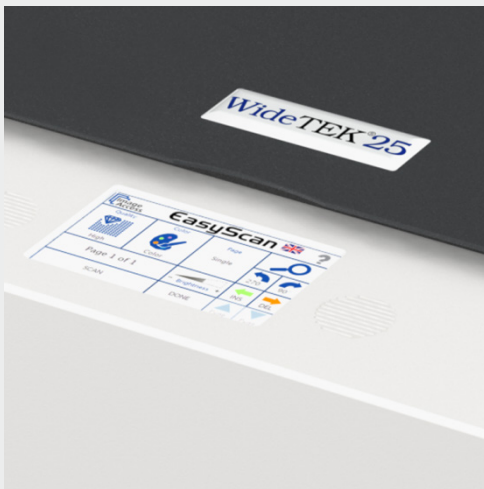
Großer, farbiger Touchscreen für einfache Bedienung