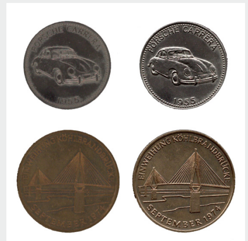
2D / 3D Modus bei Oberflächenstrukturen