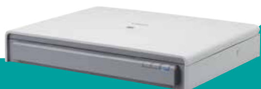
Optional erhältliche DIN A3-Flachbett-Scaneinheit 201