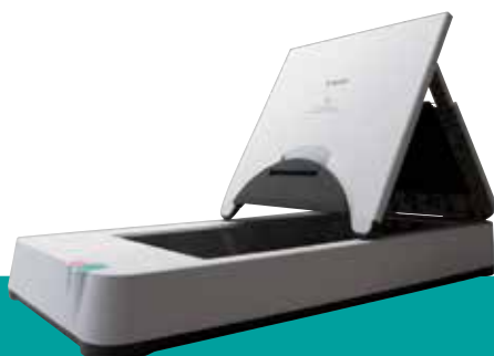
Optional erhältliche DIN A4-Flachbett-Scaneinheit 101

Dank der umfassenden Auswahl von optionalem Zubehör können Anwender mit dem DR-M1060 so produktiv arbeiten wie nie zuvor. Die optionalen Flachbett-Scaneinheiten ermöglichen es, Bücher, Zeitschriften und empfindliche Materialien zu scannen. Diese Flachbett-Scaneinheiten werden per USB verbunden und arbeiten problemlos mit dem DR-M1060 zusammen, sodass für jeden Scanvorgang die gleichen Bildoptimierungsfunktionen zur Verfügung stehen. Darüber hinaus ermöglicht das optionale 2D-Barcode-Modul die Erkennung von QR-Codes sowie von Codes in den Formaten PDF417 und Data Matrix.