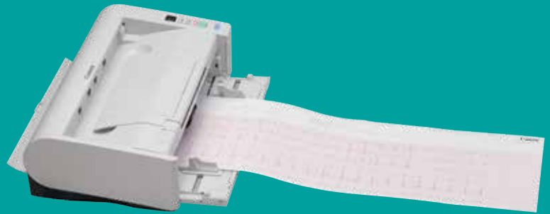
Scannen von langen Dokumenten