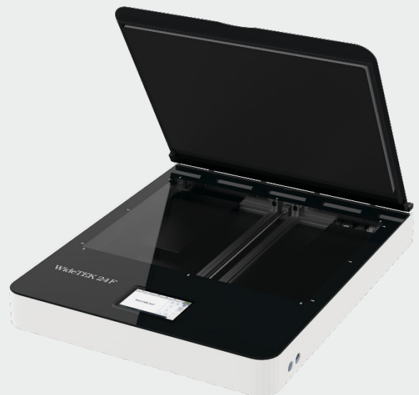
Kratzfeste Glasplatte ermöglicht das Scannen übergroßer Originale